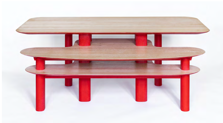
Julien Gorrias, table basse Torii